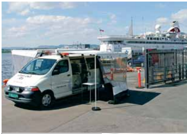
Den rullende sikkerhetslusen klar til bruk, her under et av Oslos mange cruiseanløp i sommer.