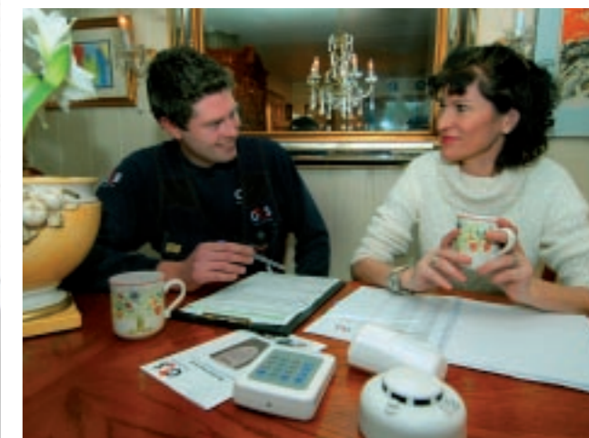
G4S sin sikkerhetsrådgiver prosjekterer detektorbehovet sammen med boligeieren.